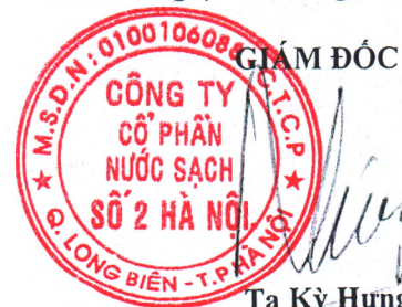
Tạ Kỳ Hưng